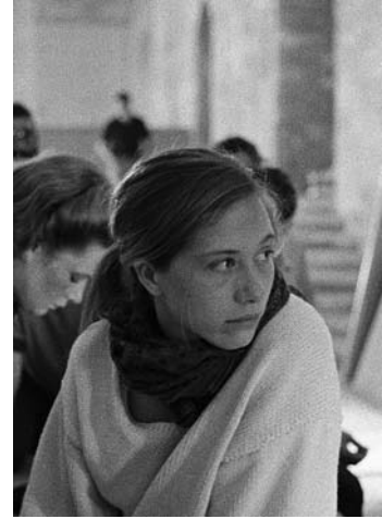
Valérie Dréville. « Les coulisses des répétitions du Soulier de Satin » Mise en scène Antoine Vitez Cour d'honneur du Palais des Papes d'Avignon, 1987.